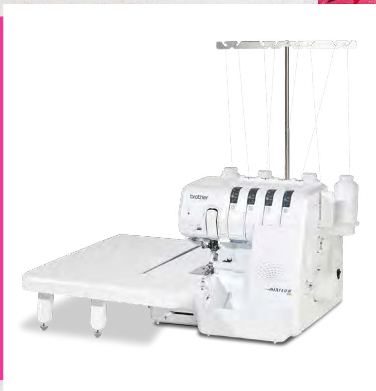
Ampia tavola di prolunga (accessorio opzionale venduto separatamente)